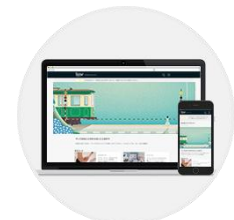
好きなコースを選ぶ

予約サイトの情報を見ながら好きなコースを選び、予約を申し込みます。予約を手配した後、日時などを記載したメールが届きます。