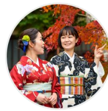
チケットを持って体験へ

予約した日時、指定の場所にて体験をお楽しみください。当日はチケットを忘れずにお持ちください。